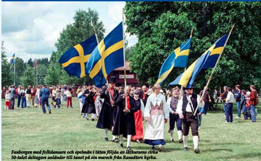
Fanborgen med folkdansare och spelmän i tåten följda av låtkursens cirka 50-talet deltagare anländer till tunet på sin marsch från Ransäters kyrka.